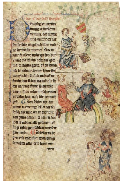
Abb. 3: Oldenburg, LB, CIM I 410, fol. 6r

Geplant ist eine Studienausgabe zum Sachsenspiegel, die auf den ältesten niederdeutschen Textzeugen der Langfassung des Sachsenspiegels basiert, wobei für das Landrecht der Leidener Codex (Abb. 2) als Leithandschrift zugrunde gelegt wird. Er wurde im ostfälischen Schreibdialekt (vermutlich Braunschweig) aufgezeichnet und steht damit dem Elbostfälischen als der mutmaßlichen Ausgangssprache des Sachsenspiegels am nächsten.