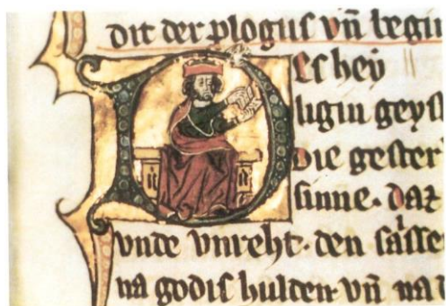
Abb. 1.: Harffer Sachsenspiegel (Privatbesitz)

Im akademischen Lehrbetrieb wird immer noch auf die Nachdrucke der alten Sachsenspiegel-Ausgaben KARL-AUGUST ECKHARDTS (Landrecht 1955; Lehnrecht, 1956) zurückgegriffen, obwohl sie heutigen Ansprüchen nicht mehr genügen können. ECKHARDT edierte nach einer von ihm rekonstruierten Fassung (Ib), die nicht nachweisbar ist und auf der sogenannten Kurzfassung (Ia) basiert, deren Textzeugen mit Ausnahme des schwer einzuordnenden Berliner Fragments (Ba) erst dem 14. Jh. angehören. Demgegenüber weist die Langfassung (Ordnung IIa), die lange im Abseits der Forschung stand, mit den Kopenhagener Fragmenten (2. Viertel / Mitte 13. Jh.) die ältesten Textzeugen der gesamten Überlieferung auf. Dieser Fassung gehören noch drei weitere Textzeugen vor 1300 an, darunter die beiden ältesten Handschriften (Leidener Codex u. Harffer Sachsenspiegel), die ebenfalls noch den elbstfälischen Dialekt der Vorlage erkennen lassen.