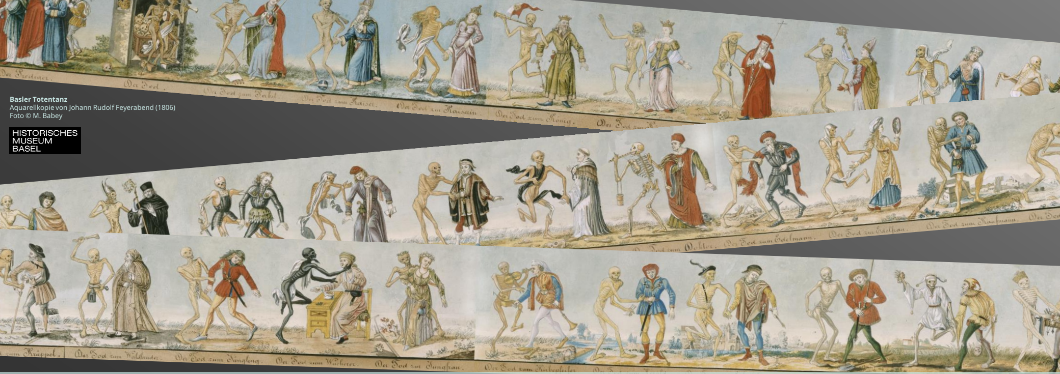
Basler Totentanz Aquarellkopie von Johann Rudolf Feyereabend (1806)